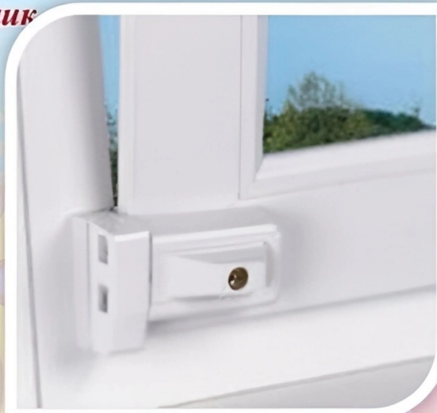
Блокировщик с кнопкой